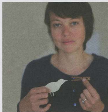
↑ Photo issue de Petite promenade bibliographique , Casterman, 2023. Photographie de T. Bellahcene.

↑ Petite promenade bibliographique , Casterman, 2023. À retrouver en ligne : https://www.edenlivres.fr/campaigns/UPdJ4f5fH9UuhEMB/participants/KNMNfmTN3XC4BKXr