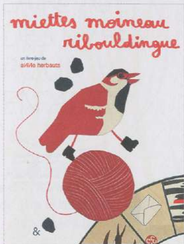
↑ ↕ ↓ Miettes moineau ribouldingue, Livre-jeu sur le principe du jeu de l'oie, à paraître fin 2023 aux éditions Esperluète.